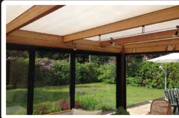
Testergebnis vom Fraunhofer Institut